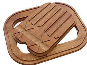
Tagliere Twin in legno Iroko 8644 003