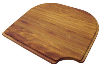
Tagliere in legno Iroko 8659 111