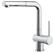
Miscelatore Gamma 8483 001