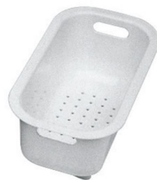
Scolapasta bianco 8151 100