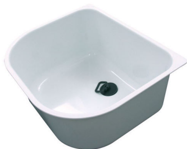
Vaschetta bianca 8152 100