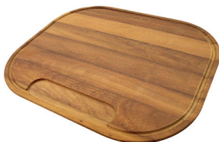
Tagliere in legno Iroko 8659 112